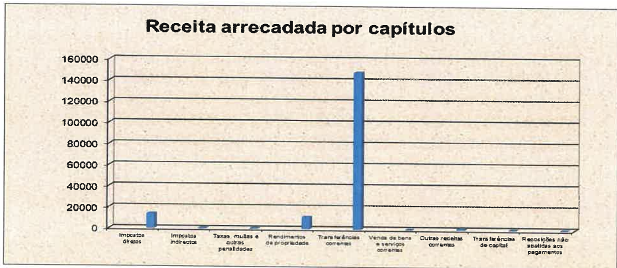
Gráfico n.º 1